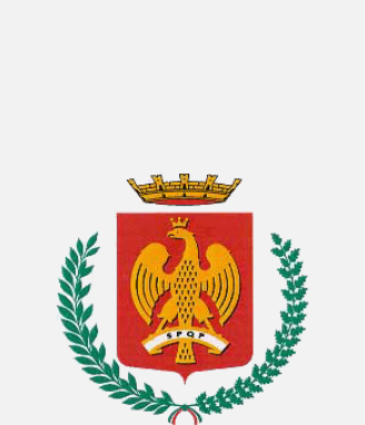
Città di Palermo

Villa Bonanno (resti romani/ Roman ruins) (2) B.3 Piazza Vittoria Villa Ida Basile (76) F.4 Via Siracusa, 15 Villa Igea (74) G.7 Salita Belmonte, 43 Villa Malfitano (75) F.2 Via Dante, 167 Villa Niscredi (66) L.5 Piazza Niscredi Villa Zito - Pinacoteca della Fondazione Sicilia (93) G.4 Via Libertà, 52 Villino Florio (77) E.2 Viale Regina Margherita, 38 Zac Zona Arti Contemporanee Cantieri culturali alla Zisa (Spazio Espositivo) (88) E.1 Via Paolo Gili, 4