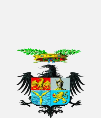
Città Metropolitana di Palermo