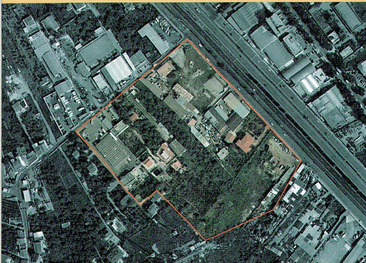
tav. 2 Datatione degli immobili e verifica amministrativa sulla loro legittimità Elaborato adeguato al D.D.G. n. 40/DRU del 31/03/2017 scala 1/1000