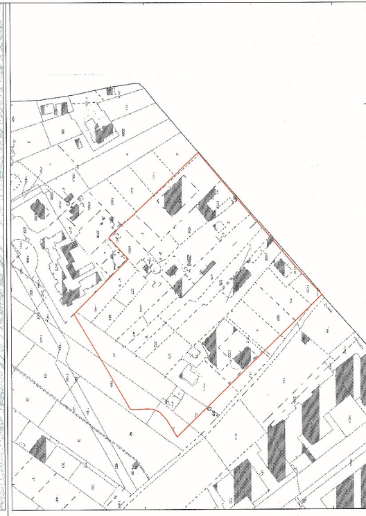
Stralco Catastale Fig 29 scala 1:2000 Area Interessata dal Piano Particolareggiato